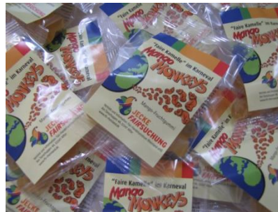
Beispiel Mango Monkeys im JF-Design