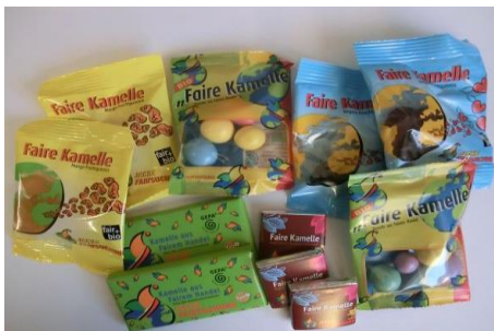
Beispiel aus dem Sortiment

Die dazugehörige digitale Broschüre „Mangos für Kinderrechte“ bieten eine gute Möglichkeit sich selbst und andere über die „Fairen Kamellen“ zu informieren. Flyer Bestellung unter jeckefairsuchung@tatort-verein.de .